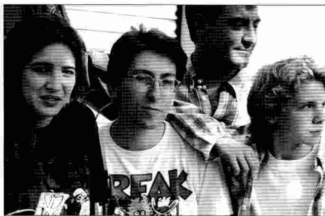
De izquierda a derecha, Lucía Jiménez, David Trueba, Jordi Bosch y Fernando Ramallo, actores y director de «La buena vida».

Entre sus responsabilidades, Tristán tiene la del cuidado de su abuelo, aquejado por una lúcida demencia senil. El personaje, encarnado por el veterano actor Luis Cuenca, le ha valido el reconocimiento como mejor interpretación masculina de reparto en la reciente edición de los Premios Goya, único galardón que ha obtenido la película, aunque estuviera nominada también para la mejor dirección novel; trofeo que fue concedido a Alejandro Amenábar por «Tesis», la gran triunfadora de esta XI edición, junto con «El perro del hortelano», de Pilar Miró, que tuvieron cada una el reconocimiento por septuplicado de la Academia ■