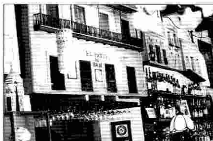
Detalle de la barra de El Patio de Sam.

Custodiado por la estatua de Juan Ponce de León, y en la misma plaza donde está la casa-museo del insigne violonchelista tarraconense Pablo Casals, en el mismo corazón del viejo San Juan, se encuentra este restaurante