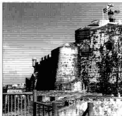
Fortaleza de San Felipe del Morro.

Y como cierre nocturno, bailar en el «hall» del hotel San Juan o del Caribe Hilton, donde mientras disfrutas de una piña colada o un daiquiri y de la sensual danza de los portorriqueños al compás del bolero o de la salsa, en los jardines cercanos el croar del «coqui», una diminuta rana existente sólo en Puerto Rico, pone su aguda nota a la cálida noche antillana. ■