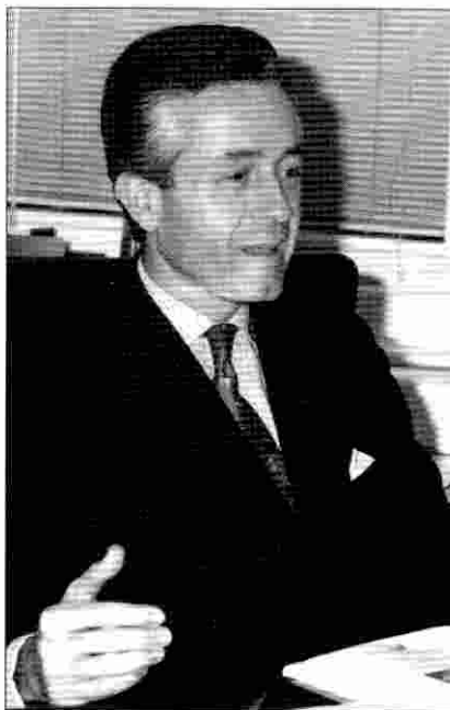
El director general defiende que la Unión Europea está interesada en el modelo español de funcionamiento del Consorcio.

—Tenemos una diferencia enorme con las entidades en lo siguiente: una entidad tiene siempre la obligación de tratar bien a un cliente, porque si no lo puede perder el año siguiente. Nosotros no perdemos ese cliente, ni lo ganamos; son las propias compañías las que nos traen los clientes. Una entidad consigue que una persona