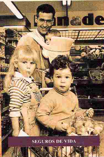
SEGUROS DE VIDA