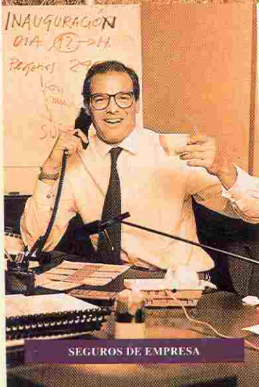
SEGUROS DE EMPRESA