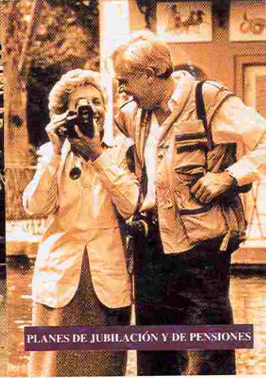
PLANES DE JUBILACIÓN Y DE PENSIONES