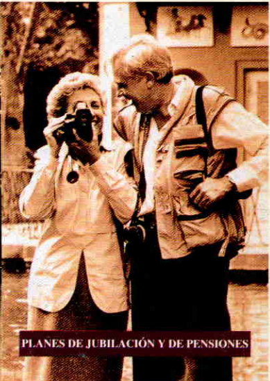
PLANES DE JUBILACIÓN Y DE PENSIONES