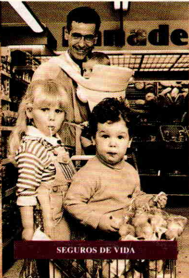
SEGUROS DE VIDA