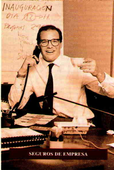
SEGUROS DE EMPRESA