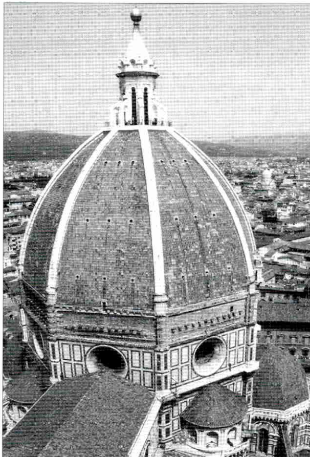
Florencia, sede del plenario del Grupo Consultivo

— El coloquio anual, que este año será el 17 de septiembre en Berlín, y versará sobre «El mercado libre europeo y la protección de los consumidores: ¿una contradicción en sí mismo?».